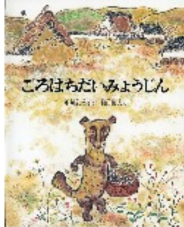
中川正文作/梶山俊夫画 1969年8月 福音館書店刊

の物、独特のものがあ まして、関西の人たち 方とか、そういうもの を非常に見事に児童文