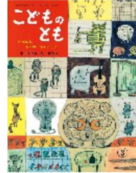
中川正文作/長 新太画 24号/1958年3月号

◆2年目の一番最後に 出したのが「がんばれ さるのさらんくん」。 長 新太さんが初めて 描いた絵本なんです。 文は、関西の童話作家 の中川正文さんです。