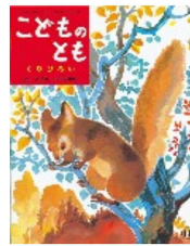
厳大椿作/山田三郎画 20号/1957年11月号

◆これが、 20号 で出した「 くりひろい 」という中国の物語です。「 厳大椿 」と書いてある。「 えんたいちん 」という人ですけども、