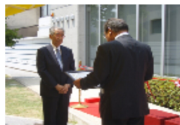
「絵本館ホール19番館」前での贈呈式