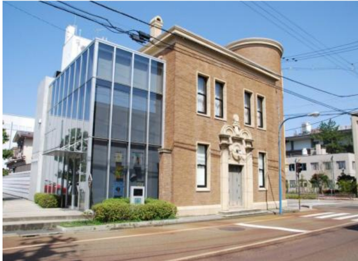
「松居直コレクション」がおひろめとなった絵本館ホール

【活動方針】①絵本の楽しさを伝える〈親子読書の奨励〉②絵本の歴史を学び、進むべき方向を考える〈絵本文化の研究〉③市が所有する知的財産として、次世代に正しく伝える〈絵本文化の継承〉